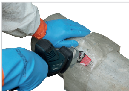
2 - DÉCOUPE

*Selon le support une version adhésive est proposée