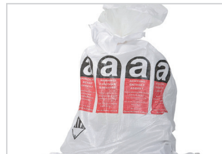
3 - ÉVACUATION

A l'aide d'une scie-sabre, découper à vitesse réduite à travers l'EGP.